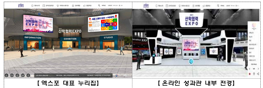
【엑스포 대표 누리집】

* 엑스포 ① 행사(개·폐막식, 포럼) 및 ② 경진대회 라이브 방송, ③ 뉴스 중계, ④ 오프라인 주제(테마)별 전시관 가상탐험 등 같은 시간대 4개 방송 채널 운영